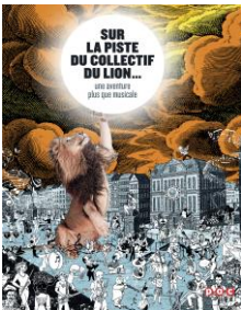
Illustration : © Racasse-Studio

14h00-14h50 : Débat : « Art et Politique Culturelle. Quelle implication pour les artistes dans l'élaboration d'une politique culturelle ? » par le Collectif du Lion.